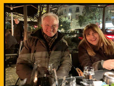
I COORDINATORI GRECI

Torneremo a Salonicco (Tessalonica) il 12