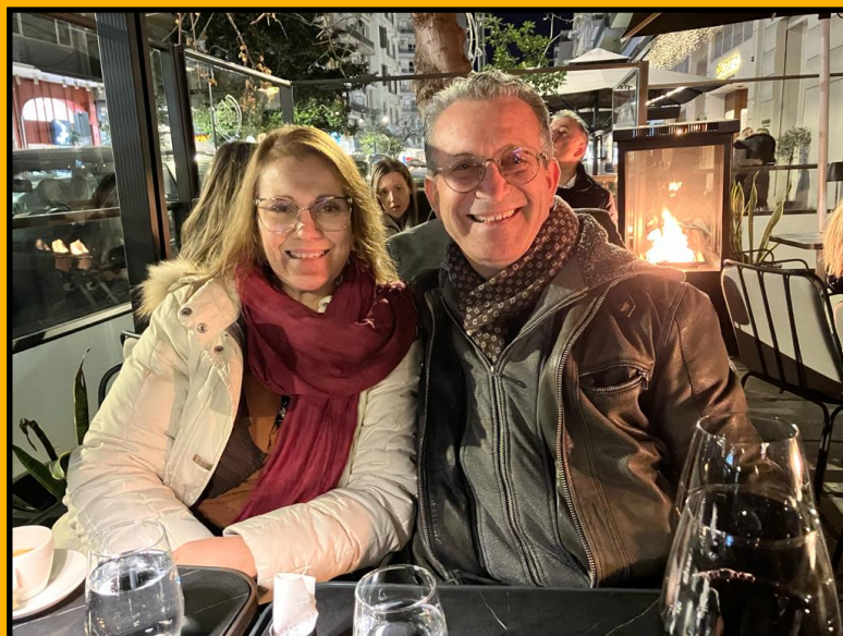
I NOSTRI COORDINATORI NAZIONALI

“Tutto è iniziato con la telefonata mensile con la nostra coordinatrice della Sede Internazionale, durante la quale ci ha chiesto se avessimo il desiderio di recarci in Grecia per condurre il Corso Fondamentale in inglese “Potere per Vivere in Abbondanza al Giorno d’Oggi”.